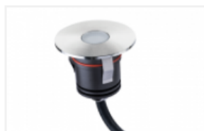
Luna Deco Opal